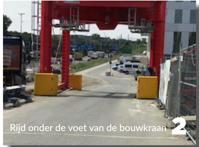
Rijd onder de voet van de bouwkraan 2