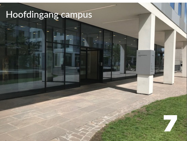
Hoofdingang campus 7