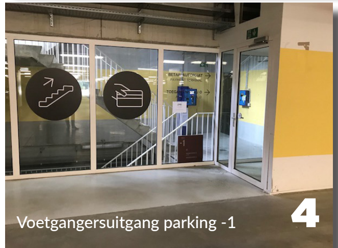
Voetgangersuitgang parking -1 4