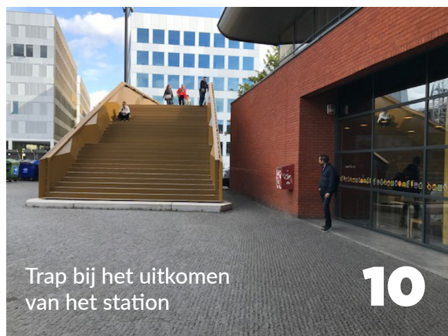
Trap bij het uitkomen van het station