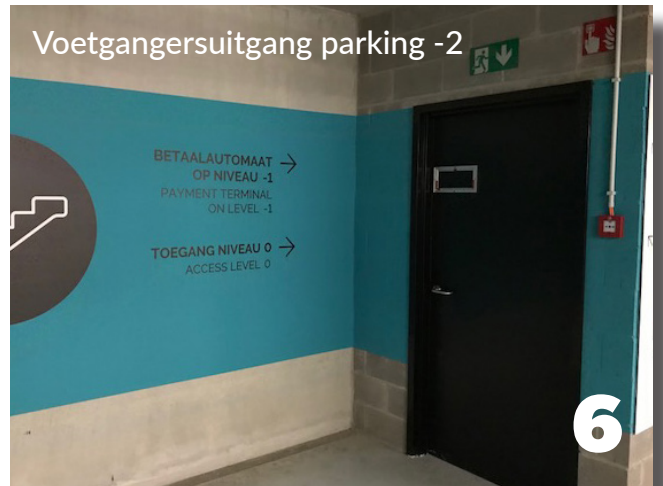
Voetgangersuitgang parking -2 6