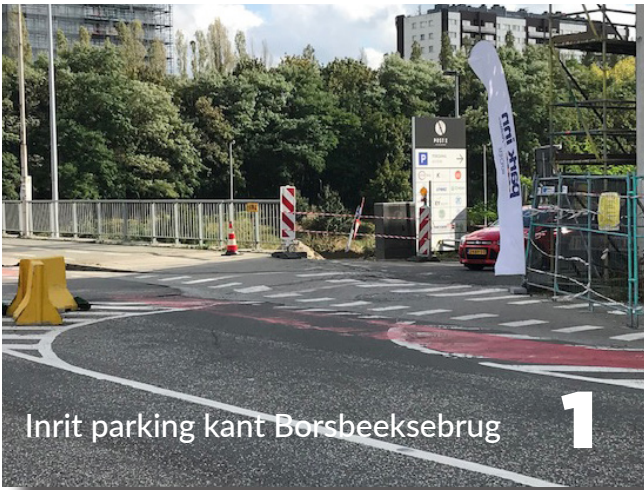
Inrit parking kant Borsbeeksebrug 1