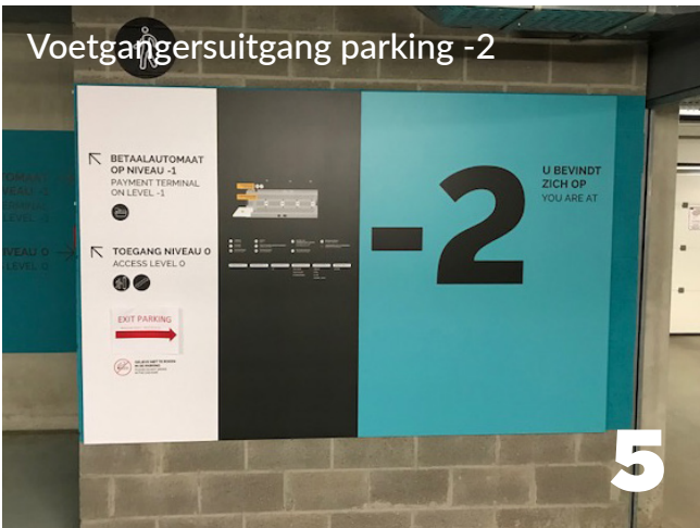
Voetgangersuitgang parking -2 5