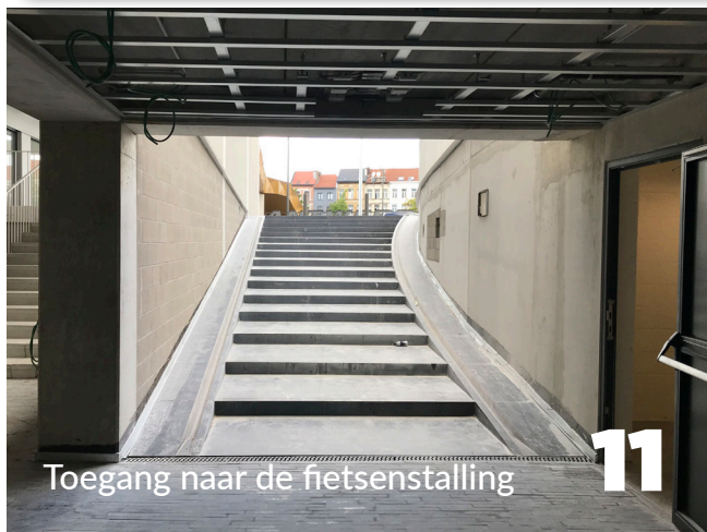
Toegang naar de fietsenstalling