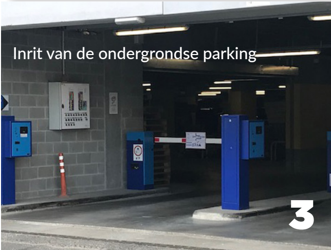
Inrit van de ondergrondse parking 3