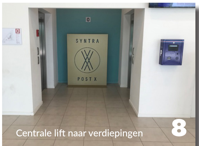
Centrale lift naar verdiepingen 8